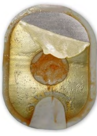
Figure 2 : le gel décollé et replié peut également sembler décoloré et/ou fondu.

Action : Appliquez les électrodes sur le patient. N'hésitez pas.