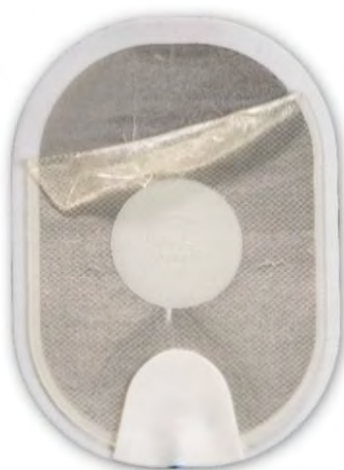
Figure 1 : gel décollé qui s'est replié sur lui-même lors du retrait de la feuille de protection.

Il est également possible que le gel se décolle presque complètement du support en mousse/étain lors du retrait de la feuille de protection (voir Figure 3.) Si la surface de contact du gel avec la peau est petite, un arc électrique peut se produire lorsqu'un choc est délivré, ce qui peut provoquer des brûlures sur la peau du patient. Il est aussi possible que le DAE ne puisse pas délivrer de choc à travers les électrodes. Un retard de traitement se produit lorsque l'utilisateur installe une cartouche d'électrodes de rechange (si disponible) ou effectue une RCP (réanimation cardiopulmonaire) ou un massage cardiaque en attendant l'arrivée du personnel des services médicaux d'urgence. À titre de comparaison, la Figure 4 montre une électrode normale. Quel que soit l'état de l'électrode, suivez les consignes vocales, car le DAE vous guidera tout au long des étapes nécessaires.