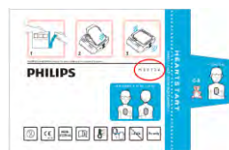
M5072A Sachet en aluminium