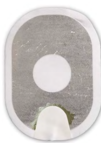
Figure 3 : gel presque complètement décollé du support.

Action : Appliquez les électrodes sur le patient. N'hésitez pas.