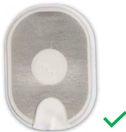
Figure 4 : électrode normale.