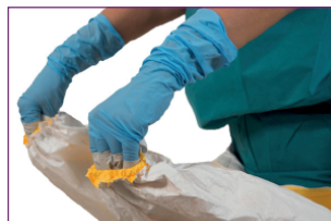
6. Retirer les manches – Avec les gants du dessus