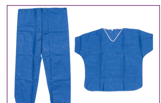
4. Un 2ème pyjama jetable est disponible pour pouvoir se déplacer vers les vestiaires pour pouvoir se rhabiller complètement.