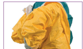
4. Dégager les épaules