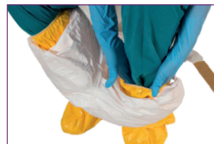
7. Retirer les jambes de la combinaison et les surbottes