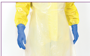
1. Mettre une nouvelle paire de gants (Si les gants du dessus sont endommagés)