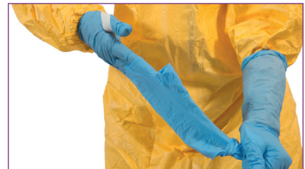
3. Retirer la première paire de gants