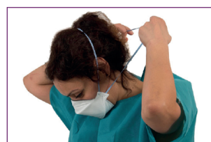
3. Retirer le masque FFP2 et refaire une désinfection complète des mains.