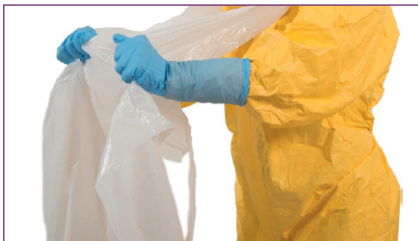
1. Retirer le tablier