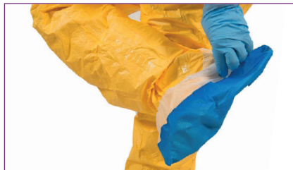
2. Retirer les sur-chaussures