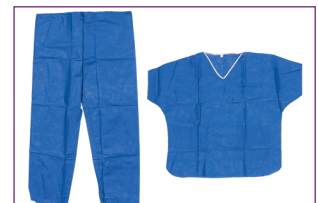
8. Enfiler un pyjama jetable