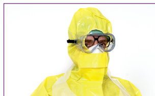
2. Retirer le masque