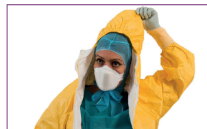
3. Retirer la cagoule chirurgicale