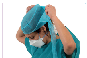
2. Retirer la cagoule